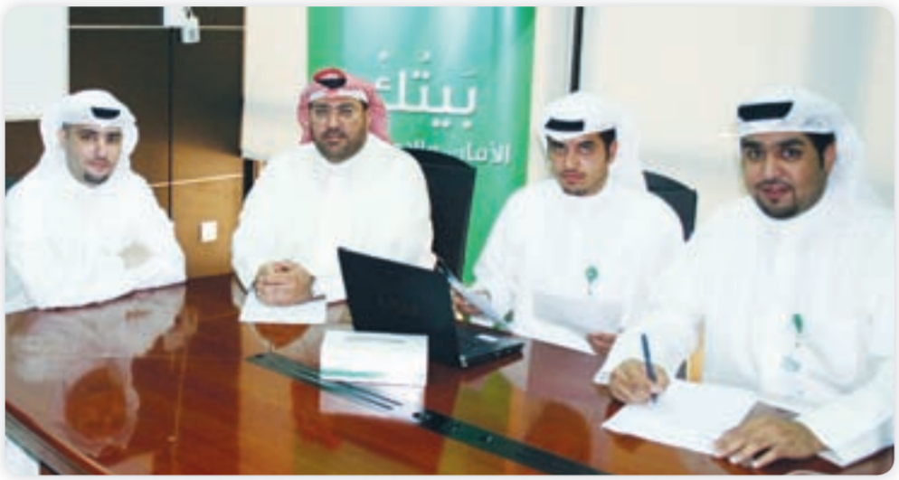
• جانب من السحب بحضور ممثل «التجارة»