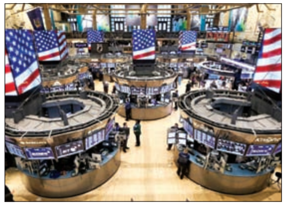
لثلاث مرات متتالية، ويعتبر البنك أن أزمة الاسواق حققت النتائج

المرجوة من رفع الفائدة والمتعلقة بتضييق السياسة التيسيرية، وهو ما حداً البنك على الإعلان عن توقعاته بعدم رفع الفائدة حتى ديسمبر على الأقل. وخفض البنك توقعاته لأسعار النفط، بسبب وفرة المعروض في أسواق النفط. وتوقع غولدمان ساكس أن ينخفض مزيج برنت العام المقبل من 62 دولاراً إلى 49,5 دولاراً للبرميل. كما خفض توقعاته لخام نايمكس من 57 دولاراً إلى 45 دولاراً للبرميل، معللاً هذه الخطوة بوفرة المعروض