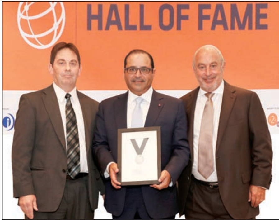
جانب من تكريم الشايح

القضايا المهمة في قطاع تجارة التجزئة والتطورات الحاصلة فيه. وتشمل فعاليات المؤتمر حفل تكريم رسمي لأعضاء قائمة الشرف من أصحاب الإنجازات البارزة في عالم تجارة التجزئة، والإشادة بالنجاحات التي حققها عدد من رواد الأعمال الذين ساهموا في تغيير نظرة العالم حول دور هذا القطاع الهام في دعم الاقتصادات المحلية والإقليمية والعالمية. وفي كل عام، تضاف أسماء جديدة من مختلف أنحاء العالم إلى قائمة الشرف التي تضم أسماء أكثر من 100 رجل أعمال في مجال تجارة التجزئة ممن كان لهم دوراً فعالاً في الارتقاء بتجارة التجزئة ومواكبة متطلبات العصر. الجدير بالذكر أن شركة الشايح هي جزء من مجموعة الشايح التجارية التي أسستها عائلة الشايح عام 1890 وتعمل