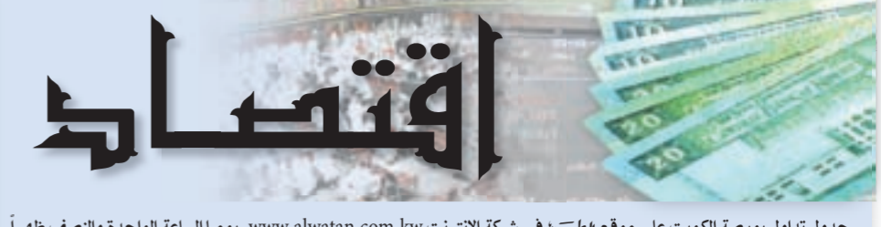
جدول تداول بورصة الكويت على موقع الوطن في شبكة الإنترنت www.alwatan.com.kw يوميا الساعة الواحدة والنصف ظهراً

لنتماشي مع أهداف المجموعة الاستراتيجية لمرحلة ما بعد بيع الأصول الأفريقية