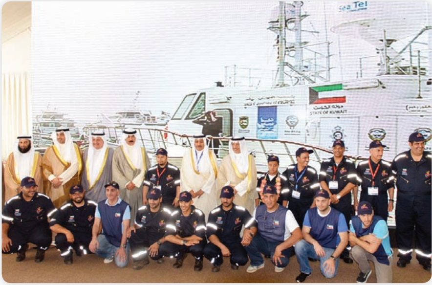
• سمو رئيس الوزراء وعدد من الوزراء مع طاقم القارب

أعلنت شركة «زين» أنها شاركت في حفل التدشين بحضور الرئيس التنفيذي للشؤون الاستراتيجية ودعم الرئيس التنفيذي شفيق السيد عمر الذي شهد انطلاق رحلة القارب نحو مملكة البحرين ومن بعدها 18 دولة حول العالم من ضمنها أسبانيا وفرنسا وبريطانيا والولايات المتحدة، ومن المتوقع لهذه الرحلة ان تستغرق 210 أيام، حيث سيتم استقبالها في شهر ديسمبر 2014.