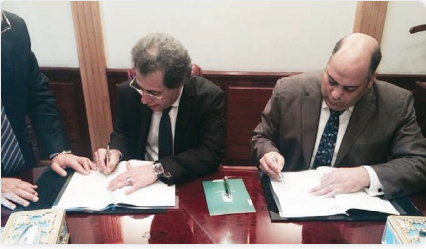
• جانب من توقيع العقد

أكبر شركات التأمين في الشرق الأوسط وشمال أفريقيا قاطبة من حيث حجم الأقساط ومن حيث المحافظ الاستثمارية وكذلك من حيث حجم الموجودات والأصول المدرة، كما تمتلك كامل أسهم شركة مصر لتأمينات الحياة التي تحتضن خبرات فنية وعلمية طويلة في هذا المجال استطاعت من خلال هذه الامكانيات ان تتبوأ مركزاً متقدماً ومرموقا في السوق المصرية للتأمين على الحياة.