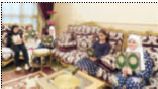
• جانب من الدورات

للجنة السادسة على التوالي تعود دار العثمان لاستئناف دورة المرحوم عبدالله عبداللطيف العثمان لحفظ القرآن الكريم واللغة العربية، والمخصصة للمرحلة الابتدائية حيث تقام الدورة كل عام ولتستأنف فيها أكثر من 100 مشترك ومشاركة سنوياً، ويصاحب الدورة العديد من